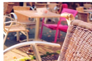
8 NOW (Tijdelijke Noodmaatregel Overbrugging Werkgelegenheid)