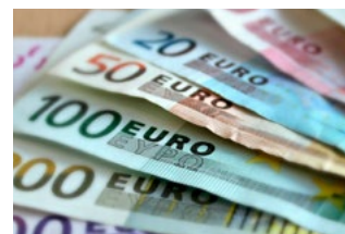
4 Wet tegemoetkomingen loondomein