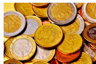
4 Wet tegemoetkomingen loondomein