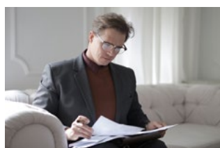
6 Varia Arbeidsrecht en sociaal zekerheidsrecht