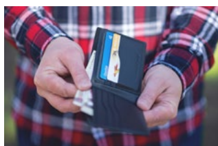
1 Varia loon- en premieheffing

Tevens bevat deze editie informatie over bijvoorbeeld de auto van de zaak, de thuiswerkvergoeding, de WKR en de transitievergoeding.