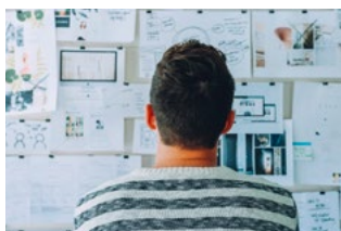
6 Wet DBA