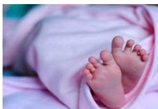
7 Varia Arbeidsrecht