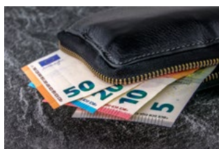
1 Varia loon- en premieheffing

Wij willen voldoen aan de wens om actueel te zijn. Maar terwijl we aan het schrijven zijn, komen er vanuit de overheid telkens nieuwe aanvullingen op of verbeteringen van (nieuwe) regelingen door corona. Het overzicht in deze special is geschreven met de kennis tot en met 15 juni 15:00 uur.