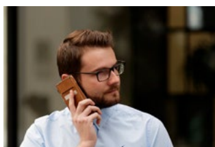
2 Wet arbeidsmarkt in balans (WAB)