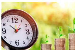
5 Wet tegemoetkomingen loondomein