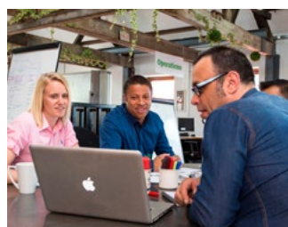
3 Ondernemers en ondernemingen