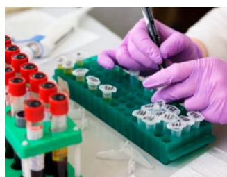
6 Vastlegging coronasteunmaatregelen