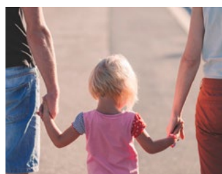
7 Overige en eerder aangekondigde maatregelen

Dit document bevat voorstellen van het kabinet die de komende periode in het parlement worden behandeld. De voorgestelde maatregelen treden per 1 januari 2021 in werking, tenzij anders is vermeld.