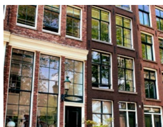
2 Onroerend goed