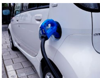
5 Vervoer en verduurzaming