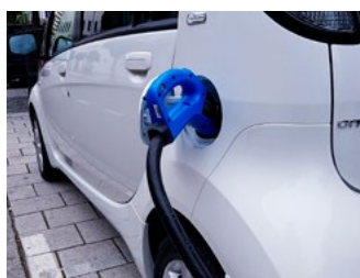
5 Vervoer en verduurzaming