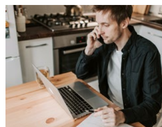
8 Overige eerder aangekondigde en te verwachten voorstellen