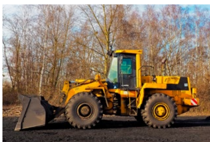
2 Wet DBA gaat op de schop