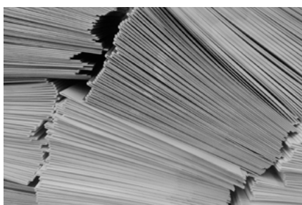
5 Varia loon- en premieheffingen