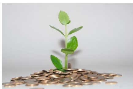
1 Wet tegemoetkomingen loondomein